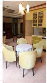
③洋室 テレビ設置有・中庭も利用可能