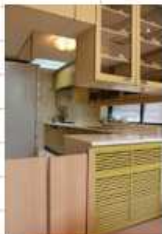
内側施錠型ゲート