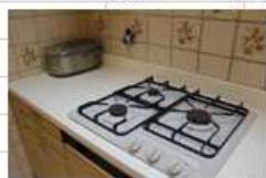
炊飯器と3口ガスコン