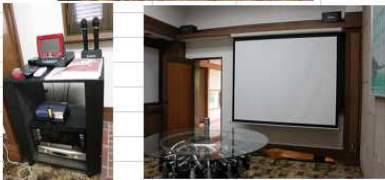
①プロジェクター室 カラオケ・スクリーン・プロジェクター設置有