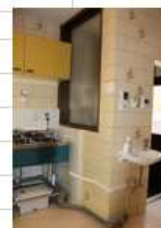
食器洗い専用流し(左) 手洗い洗面(右)