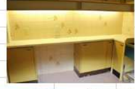
独立型パントリー 兼作業スペース