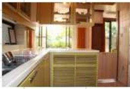
洋室への対面式L字型キッチン