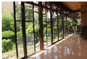
くつろぎスペース